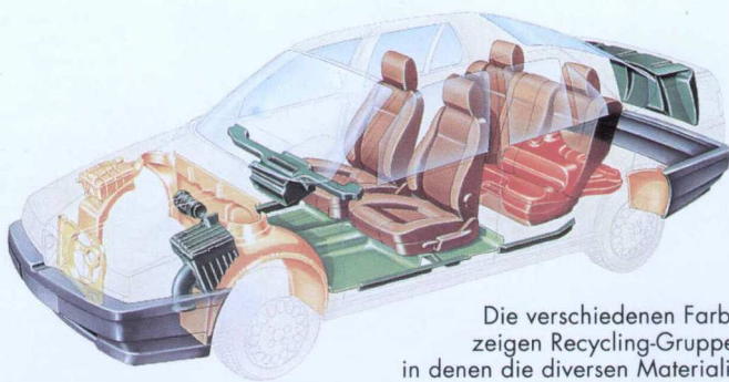
Die verschiedenen Farben zeigen Recycling-Gruppen, in denen die diversen Materialien wiederverwertbar sind.

bare Stoffe sollen Lösungen gefunden werden, sie zur Energie-Rückgewinnung nutzbar zu machen.