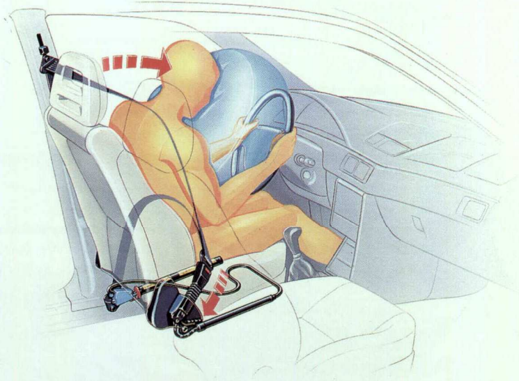
Airbag und Gurtstrammer bieten im Fall des Falles optimalen Schutz.

das „Nicken“ des Wagens während des Bremsens. Die leistungsstarke Bremsanlage kann durch ein ABS der neuesten Generation ergänzt werden. Mit dem Frontantrieb lassen sich viele Fahrsituationen leichter beherrschen. Ein Fahrer-Airbag wird in Kombination mit Gurtstrammern angeboten. Als Schutz bei einem seitlichen Aufprall wurden robuste Stahlverstärkungen in die