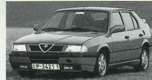
1983: Alfa Romeo 33