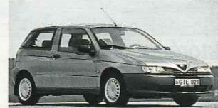
1994: Alfa Romeo 145