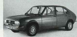
1971: Alfa Romeo Alfesud