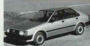
1983: Alfa Romeo Arna