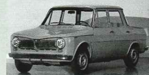
1961: Alfa Romeo Tipo 103